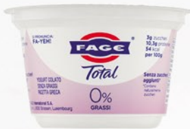
FAGE Total 0% 150g

È il tradizionale “yogurt colato” con un perfetto equilibrio tra sapore ricco e consistenza cremosa e densa. Nutriente e ricco di proteine. Da usare da solo, in aggiunta ad altri ingredienti o per preparare versioni salutari di ricette tradizionali e non.