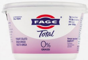
FAGE Total 0% 450g

Codice First 23278 Confezioni per collo 6 COD. EAN 5201054017135