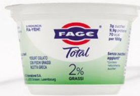
FAGE Total 2% 150g

Codice First 23276 Confezioni per collo 6 COD. EAN 5201054017111