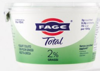
FAGE Total 2% 450g

Codice First 23279 Confezioni per collo 6 COD. EAN 5201054017616