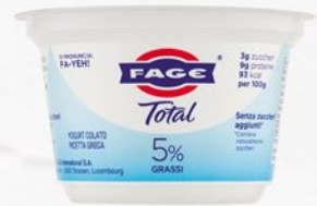
FAGE Total 5% 150g

Codice First 23277 Confezioni per collo 6 COD. EAN 5201054017128