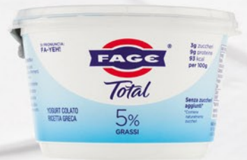
FAGE Total 5% 450g

Codice First 23280 Confezioni per collo 6 COD. EAN 5201054017623