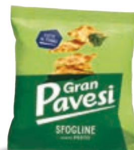
23162 SFOGLINE PESTO 30 Gr EAN Monoporzione 80863755 16 Conf. x 6 Mono 96 pz collo