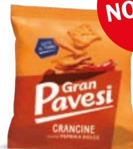
23152 CRANCINE PAPIKA 30 Gr EAN Monoporzione 80892663 16 Conf. x 6 Mono 96 pz collo