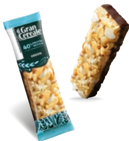
22508 BARRETTA COCCO, CIOC FOND, MANDORLE 28 Gr

EAN Monoporzione 80976271 12 Conf. x 4 mono 48 pz collo