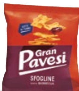
23164 SFOGLINE BARBECUE 30 Gr EAN Monoporzione 80854692 16 Conf. x 6 Mono 96 pz collo