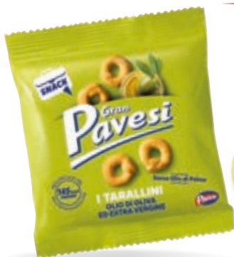
15194 TARALLINI 32 Gr EAN Monoporzione 80960171 10 Conf. x 8 Mono 80 pz collo