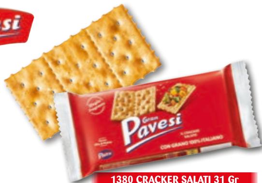
1380 CRACKER SALATI 31 Gr EAN Monoporzione 80550549 12 Imb. x 8 Mono 96 pz collo