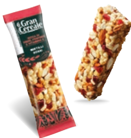
22466 BARRETTA AVENA, MANDORLE, MIRTILLI ROSSI 25 Gr

EAN Monoporzione 80838999 12 Conf. x 5 mono 60 pz collo