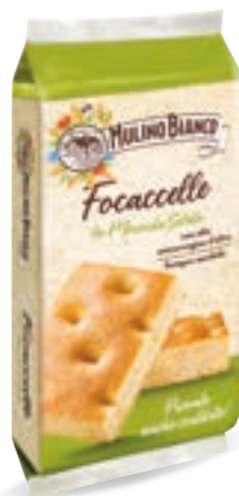
12278 FOCACCELLE OLIO D'OLIVA 33 Gr EAN Monoporzione 80417927 9 Conf. x 6 Mono 54 pz collo