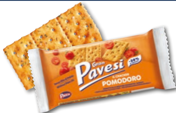
15445 CRACKER POMODORO 35 Gr EAN Monoporzione 80847137 4 Imb. x 8 Mono 32 pz collo