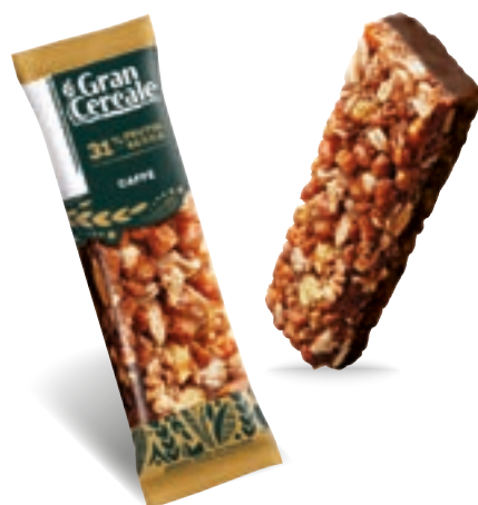
22514 BARRETTA CAFFÈ CIOC FOND NOCC 28 Gr

EAN Monoporzione 80857501 12 Conf. x 4 mono 48 pz collo