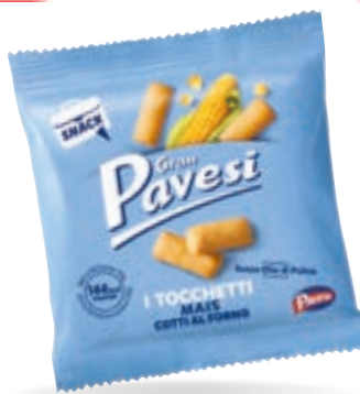
15192 TOCCHETTI AL MAIS 32 Gr EAN Monoporzione 80957485 10 Conf. x 8 Mono 80 pz collo