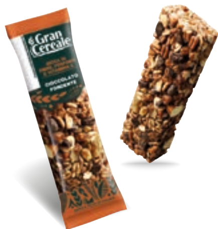
22479 BARRETTA AVENA, CIOC FONDENTE, NOCCIOLA 25 Gr

EAN Monoporzione 80838999 12 Conf. x 5 mono 60 pz collo