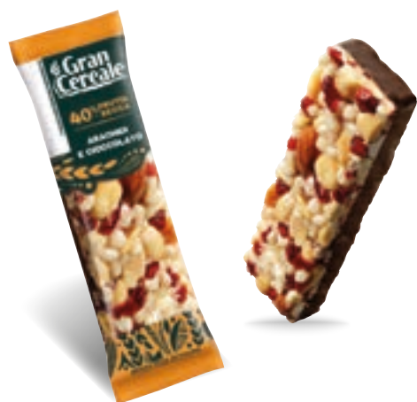
22498 BARRETTA ARACH, CIOC FOND, MIRTILLI ROSSI 28 Gr

EAN Monoporzione 80854623 12 Conf. x 5 mono 60 pz collo