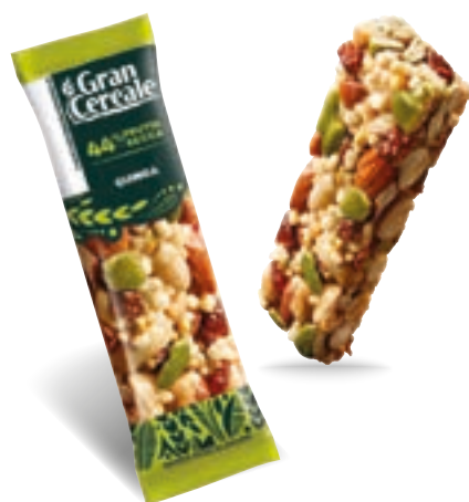
22492 BARRETTA QUINOA, SEMI DI ZUCCA, UVETTA 28 Gr

EAN Monoporzione 80842408 12 Conf. x 4 mono 48 pz collo