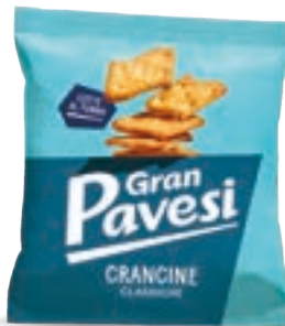
23150 CRANCINE CLASSICHE 30 Gr EAN Monoporzione 80838982 16 Conf. x 6 Mono 96 pz collo